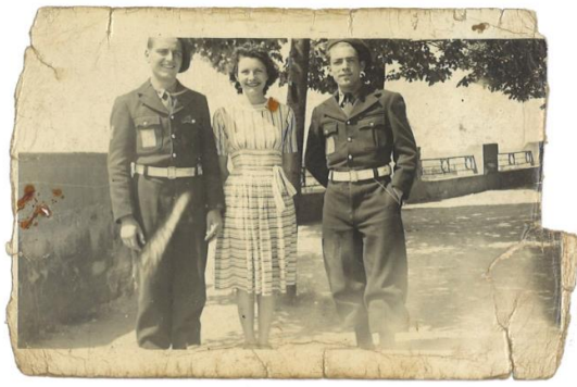
Montluçon Mai 1943